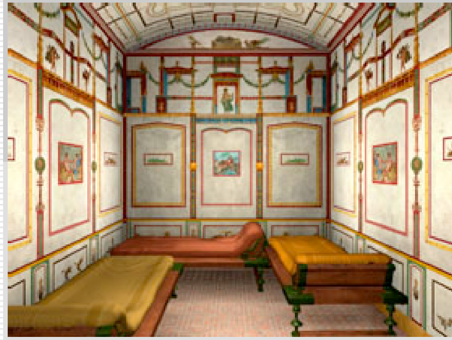
La casa di Iulius Polybius